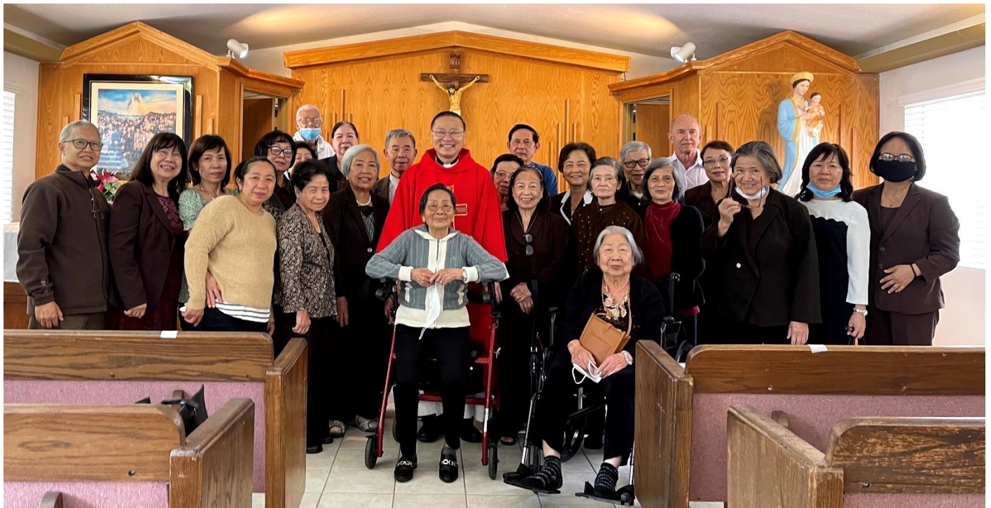
First In- Person meeting of the Vietnamese speaking St Anthony of Padua Fraternity in San Diego after COVID-19.